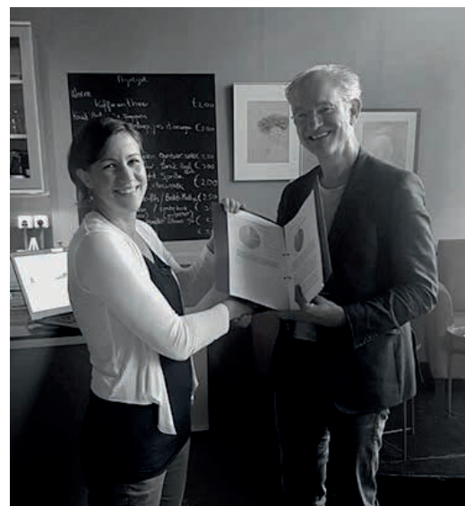
Voorzitter neemt onderzoeksagenda in ontvangst.