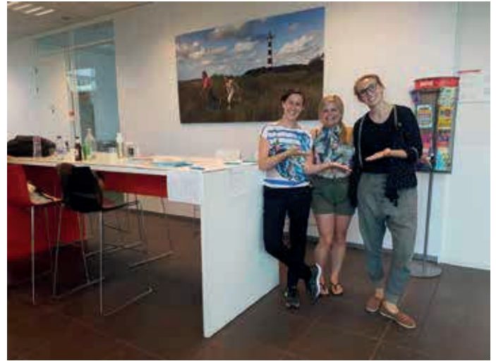
NVDT promoten op de HU.

We hebben jouw hulp nodig om verder te kunnen groeien!